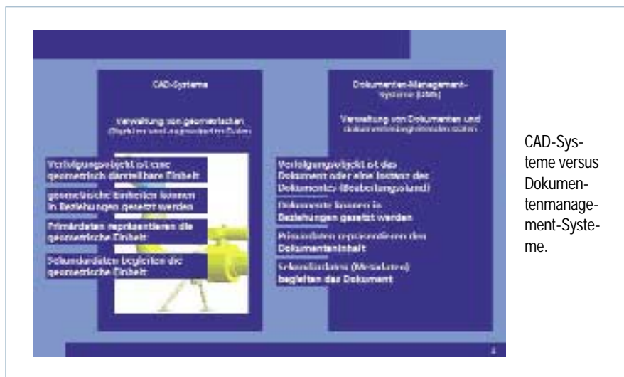
CAD-Systeme versus Dokumentenmanagementsysteme.

Trotz langjähriger Praxis bei der Integration von CAD- und DMS-Lösungen gibt es nach wie vor einige weitgehend ungelöste Punkte. So stellt die automatische Übergabe von im CAD-Umfeld erzeugten Dokumenten an das Dokumentenmanagementsystem eine erhebliche Herausforderung dar. Es wird spätestens dann problematisch, wenn dem DMS die erforderlichen Metadaten bereitgestellt werden sollen. Häufig gilt es, diese vor Übertragung an das DMS aufzubereiten. Besonders schwierig wird es, wenn sich die im DMS benötigten Metadaten nicht direkt aus dem CAD-Modell ableiten lassen, sondern über Umwege aus Drittanwendungen oder Fremddatenbanken zu ermitteln sind. Die dafür fehlenden Funktionen in CAD- und Dokumentenmanagementsystemen machen meist kostenintensive individuelle Anpassungen erforderlich.